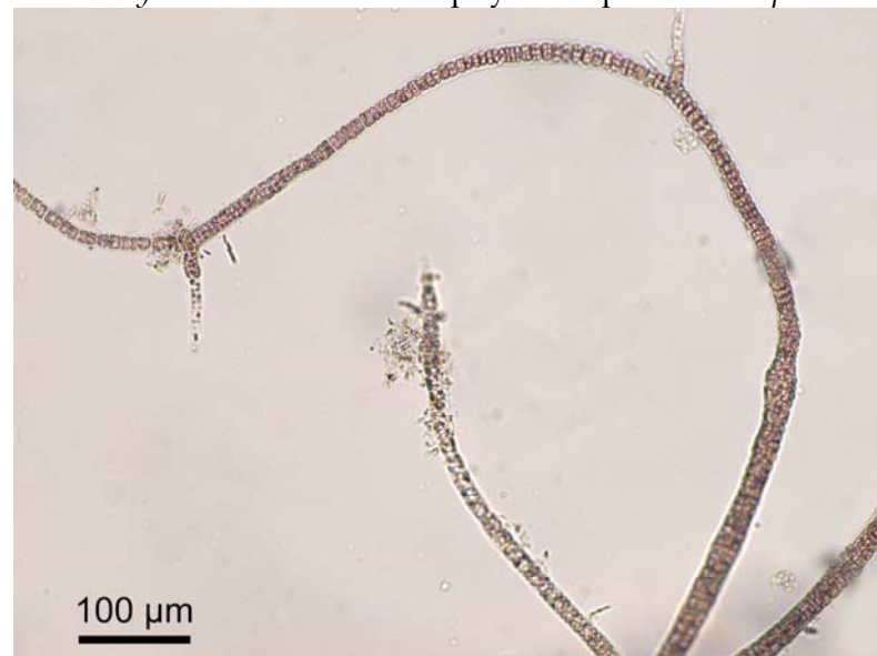
Basaal, subapicaal en apicaal deel uniseriaat, mediaan deel pluriseriaat