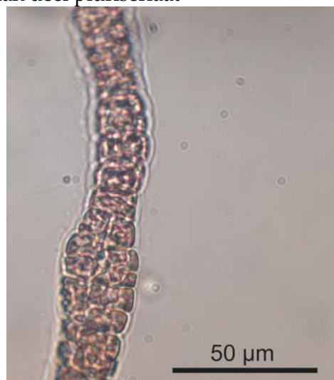
Basaal deel uniseriaat (links); mediaan deel pluriseriaat (rechts)